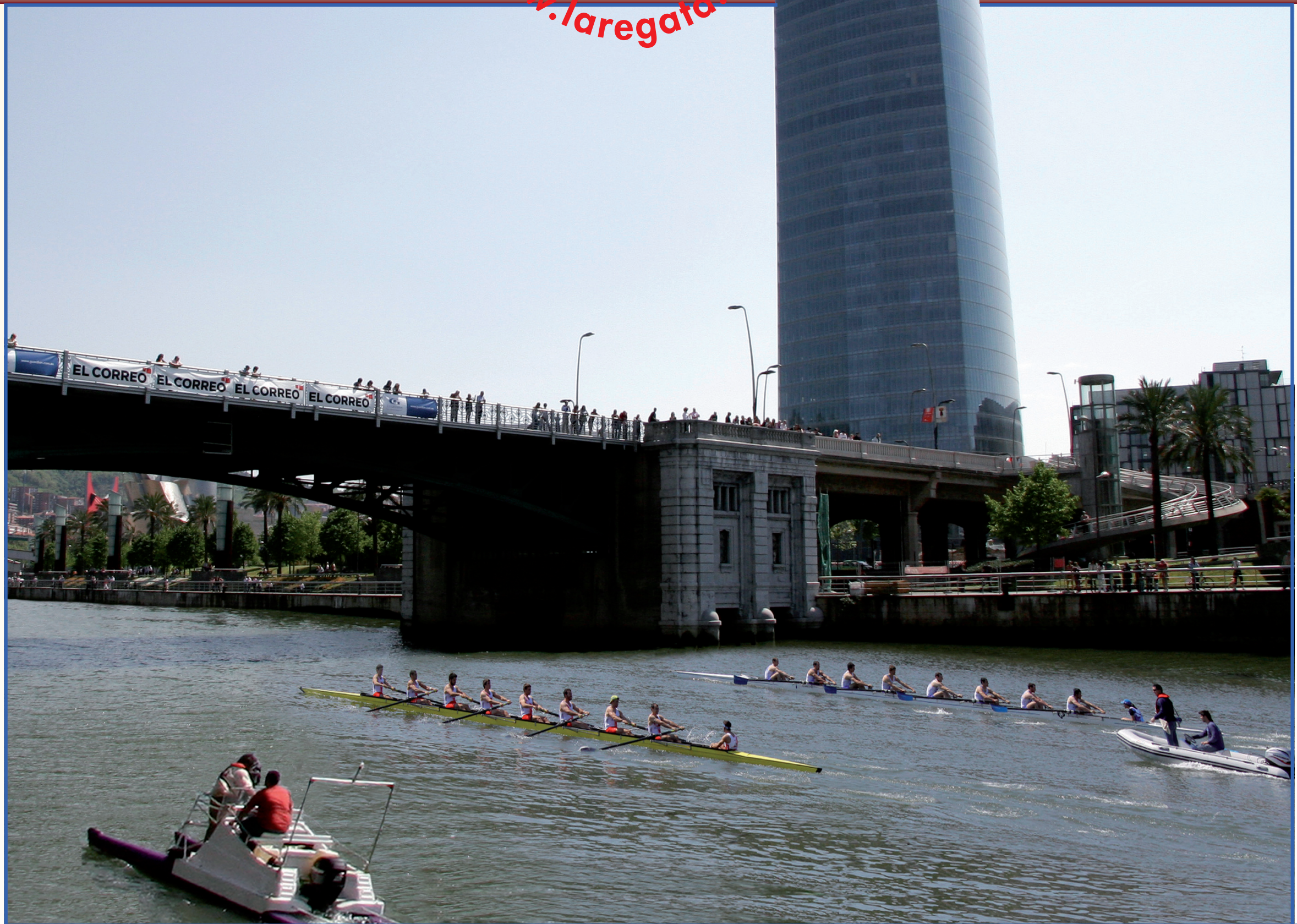
Maquetación: Manu de Alba

Deusto Universidad de Deusto Deustuko Unibertsitatea