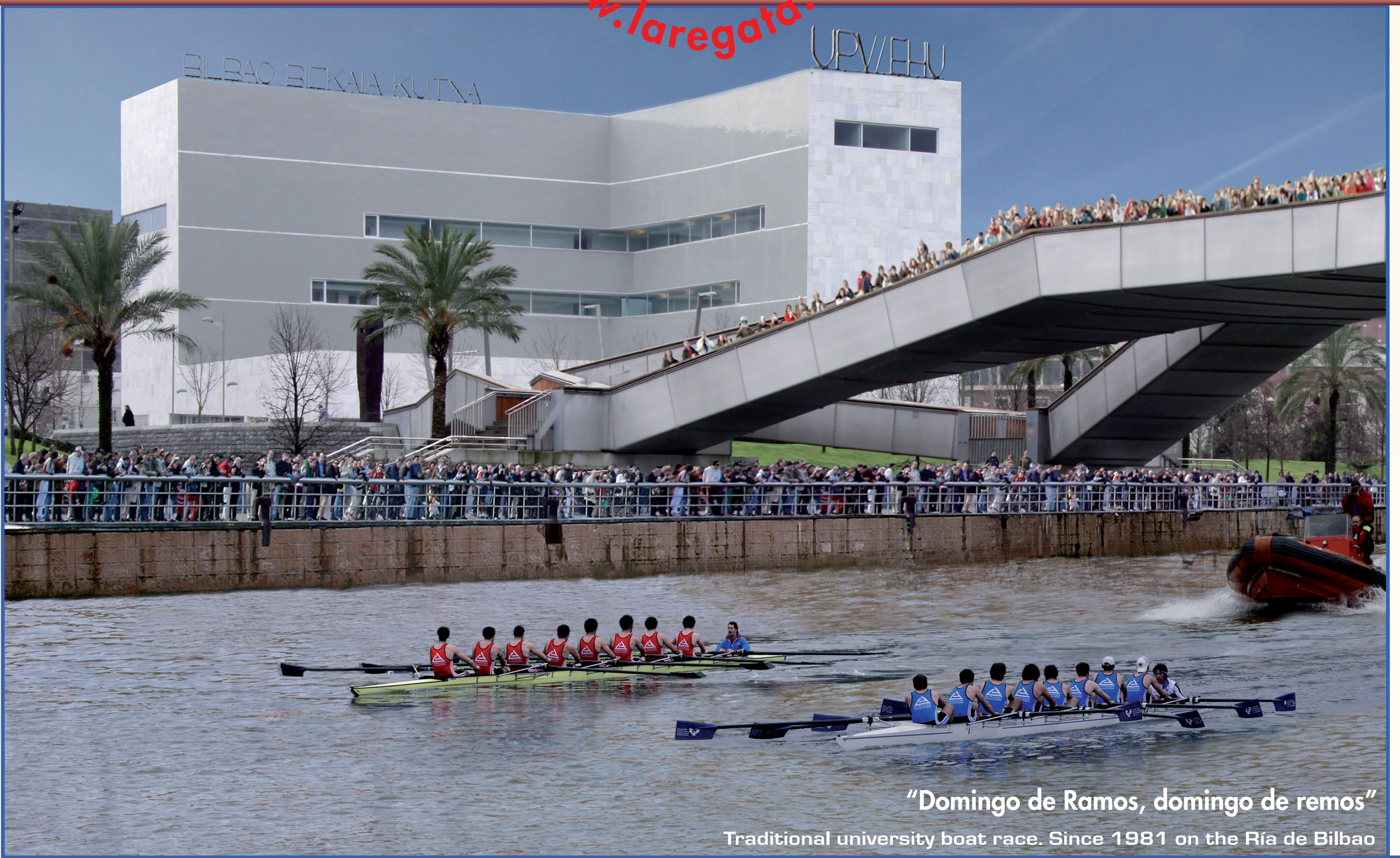
Maquetación: Manu de Alba

Deusto Universidad de Deusto Deustuko Unibertsitatea